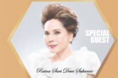
レディーデヴィスカルノアワード ラトナサリデヴィスカルノ